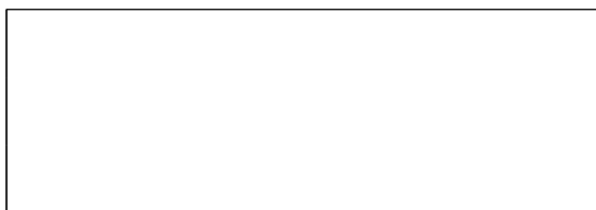
Схема границы балансовой принадлежности тепловых сетей

Прочие сведения по установлению границ раздела балансовой принадлежности тепловых сетей _____.